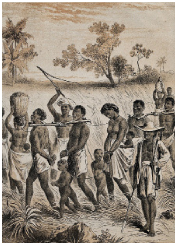
Grupo de personas siendo llevado a un mercado de esclavos ~ Imagen: Wikimedia Commons

La resolución, que coincide con el 25º aniversario de la Declaración y Programa de Acción de Durban, afirma que la trata de africanos esclavizados y la esclavitud racializada de africanos representan “la injusticia más inhumana y duradera contra la humanidad” debido a “su magnitud, duración, carácter sistémico, brutalidad y consecuencias duraderas que siguen estructurando la vida de todas las personas a través de regímenes racializados de trabajo, propiedad y capital”.