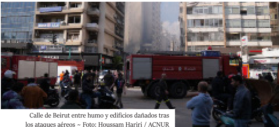
Calle de Beirut entre humo y edificios dañados tras los ataques aéreos

Tres días después de los devastadores ataques aéreos israelíes que sacudieron Líbano, el balance de víctimas no deja de aumentar. Según las últimas cifras del Ministerio de Salud libanés, unas 300 personas murieron y más de 1.150 resultaron heridas en los bombardeos del 8 de abril, lo que lo convierte en uno de los días más mortíferos desde la reanudación de las hostilidades a gran escala entre las fuerzas israelíes y los militantes