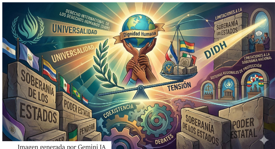
Imagen generada por Gemini IA

En este contexto, el DIDH se presenta como un sistema normativo que pretende limitar el poder, establecer estándares mínimos de conducta y generar mecanismos de responsabilidad internacional. Sin embargo, esta pretensión universal enfrenta resistencias constantes, especialmente cuando las normas internacionales entran en tensión con decisiones soberanas adoptadas por los Estados en función de sus realidades políticas, culturales o estratégicas.