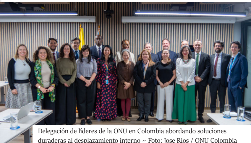
Delegación de líderes de la ONU en Colombia abordando soluciones duraderas al desplazamiento interno

B OGOTÁ — Los líderes de Naciones Unidas para soluciones duraderas al desplazamiento interno visitaron