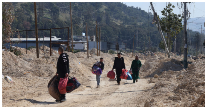
Familia palestina en el campo de refugiados de Nur Shams, en el norte de Cisjordania.

En la Franja de Gaza, el informe detalla la continuación de la matanza y mutilación de un número sin precedentes de civiles por parte de las fuerzas israelíes durante el período analizado. También documenta la propagación de la hambruna y la destrucción de la infraestructura civil remanente, lo que impone a los palestinos “condiciones de vida cada vez más incompatibles con su existencia continuada en Gaza como grupo”.