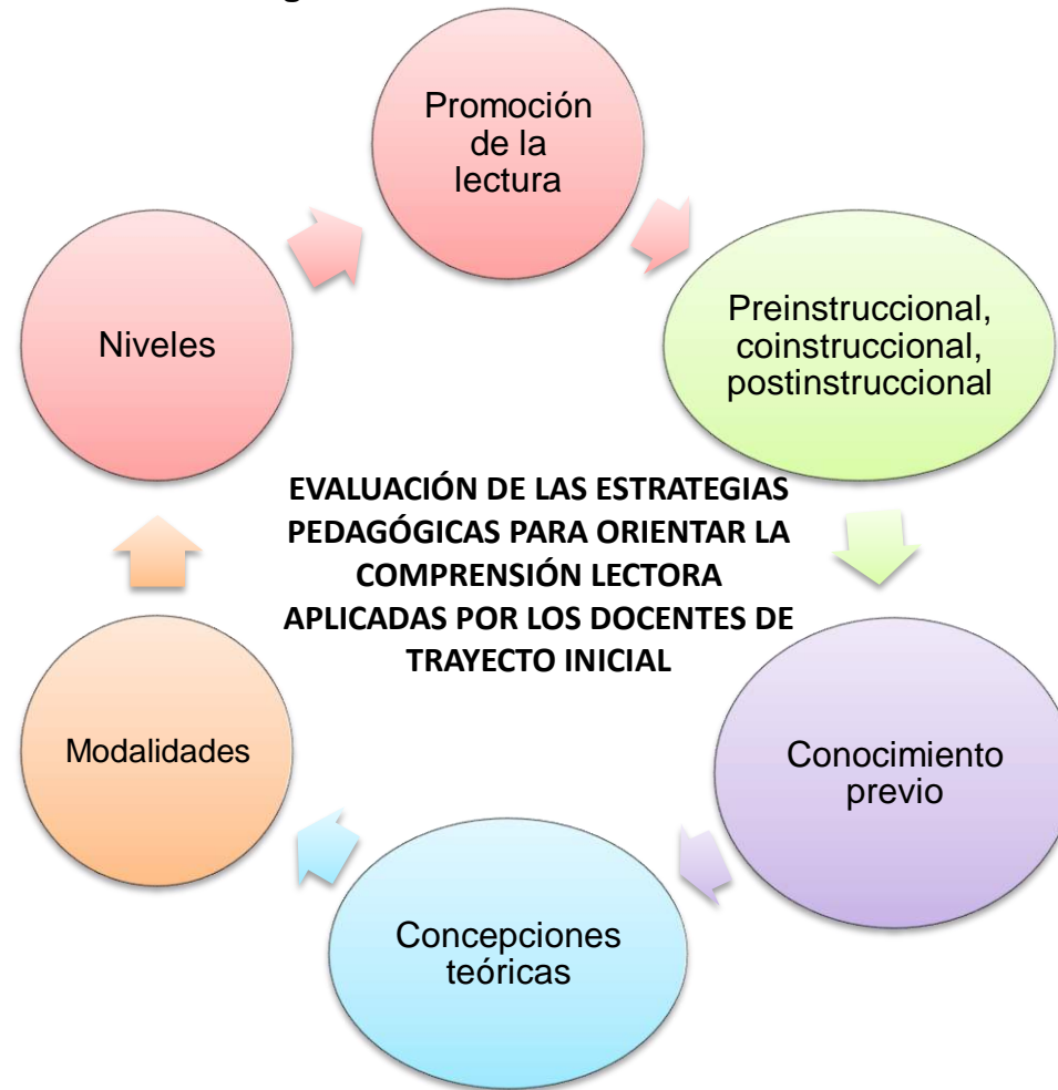
Diagrama 1. Discriminación de las Categorías Desarrolladas.