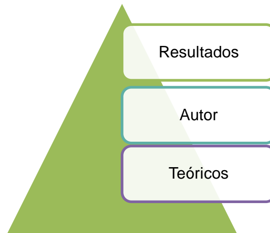
Ilustración 1. Triangulación.