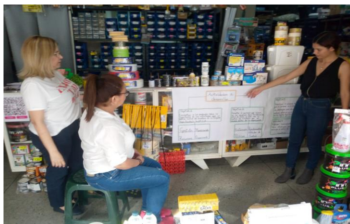
Desarrollo de la propuesta Charla al Gerente de las estrategias