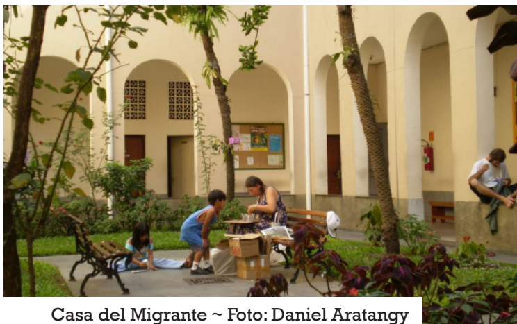
Casa del Migrante