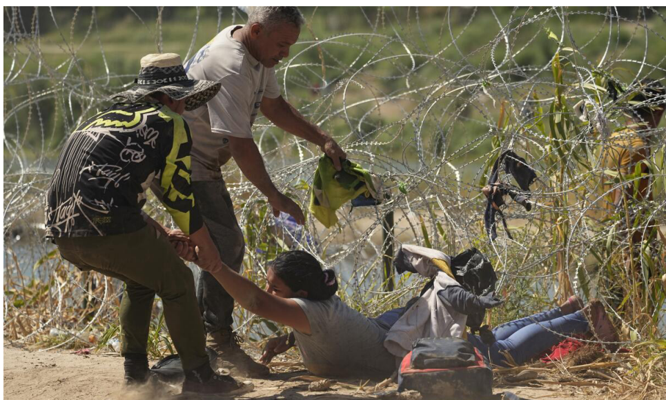
Río Bravo, 21 de septiembre de 2023, en Eagle Pass, Texas

L a situación migratoria con la llegada de siete millones de personas desde 2020 a la frontera entre México y Estados Unidos, con siete mil personas a diario en 2023, clasifica como crisis. La manifestación de esta migración sobre el entorno es tan fuerte que su contención escapa al control y la capacidad de manejo de expertos y autoridades en Estados Unidos. Esa dificultad en contener la movilidad se derrama sobre otros espacios, como el de ciudades que quedan saturadas de migrantes en sus centros de albergue, con sistemas de protección social presionados por falta de abasto, o con aumento de basura en las calles.