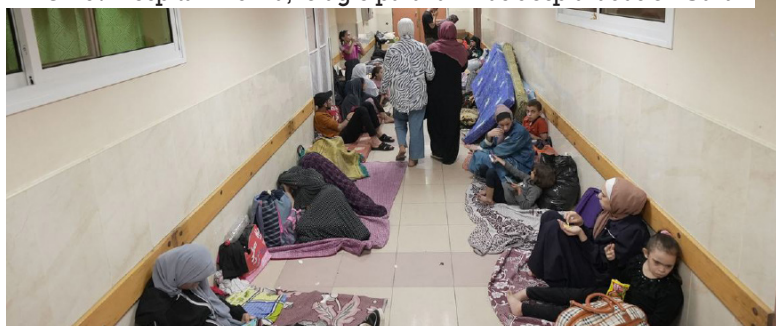
Hospital Al Shifa, refugio para familias desplazadas en Gaza

En los tres meses que van de junio a finales de septiembre, ACNUR calcula que el número de desplazados forzados aumentó en 4 millones, lo que eleva el total a 114 millones. El conflicto en Oriente Medio estalló el 7 de octubre, más allá del periodo cubierto por este informe, que por tanto no tiene en cuenta sus consecuencias en términos de desplazamientos humanos.