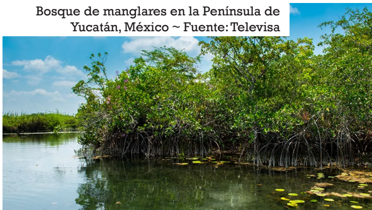
Bosque de manglares en la Península de Yucatán, México

Entre las medidas de adaptación más conocidas están la construcción de infraestructuras más seguras, sostenibles y resilientes, la conservación y restauración de bosques y ecosistemas naturales, la aplicación de soluciones basadas en la naturaleza, la gestión de riesgos ante desastres naturales o la diversificación de cultivos.