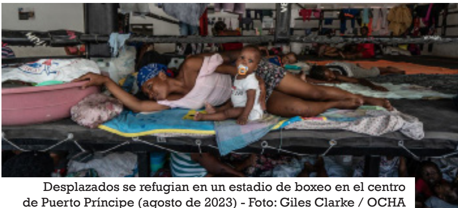
Desplazados se refugian en un estadio de boxeo en el centro de Puerto Príncipe (agosto de 2023)

La agencia de la ONU señaló que la capacidad de las familias de acogida para apoyar a la población desplazada se ha agotado dado lo prolongado de la crisis, ocasionando nuevos desplazamientos y mayor precariedad.