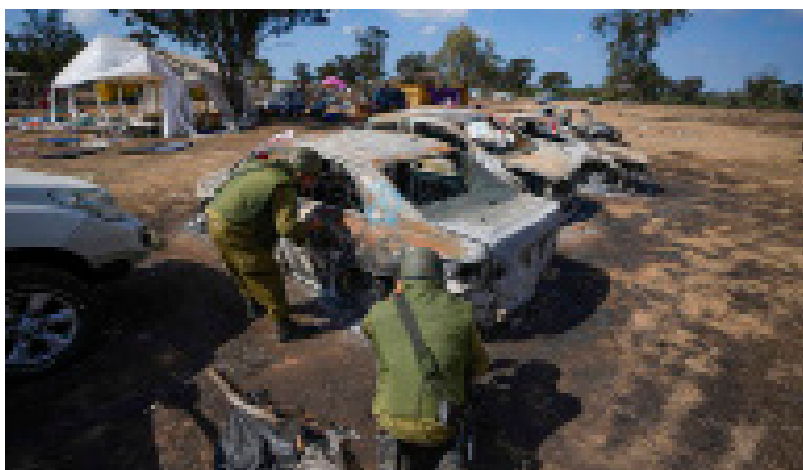
Soldados israelíes inspeccionan el sitio del festival de música atacado por Hamás

Alrededor de un millón de personas han sido desplazadas de sus hogares en la franja de Gaza por la guerra que estalló el sábado 7 de octubre después del ataque de la milicia palestina Hamás contra Israel, según ha indicado la agencia de la ONU para los refugiados palestinos (UNRWA). Más de 2.670 personas han muerto por los bombardeos sobre Gaza, que han continuado esta madrugada, y al menos 9.600 han resultado heridas. En Israel hay 1.400 fallecidos por los ataques de Hamás. 2