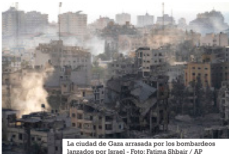
La ciudad de Gaza arrasada por los bombardeos lanzados por Israel

A pesar de que la mayoría de los hogares en la Franja de Gaza están conectados a una red de suministro de agua, la disponibilidad del recurso es muy limitada. Según la Oficina de Coordinación de Asuntos Humanitarios de las Naciones Unidas (OCHA), en 2017 las familias en Gaza recibieron agua corriente solo durante un período de seis a ocho horas cada cuatro días, una circunstancia atribuida principalmente a la escasez de energía. Esta ya de por sí limitada disponibilidad se vio aún más mermada con los sucesivos ataques en la región.