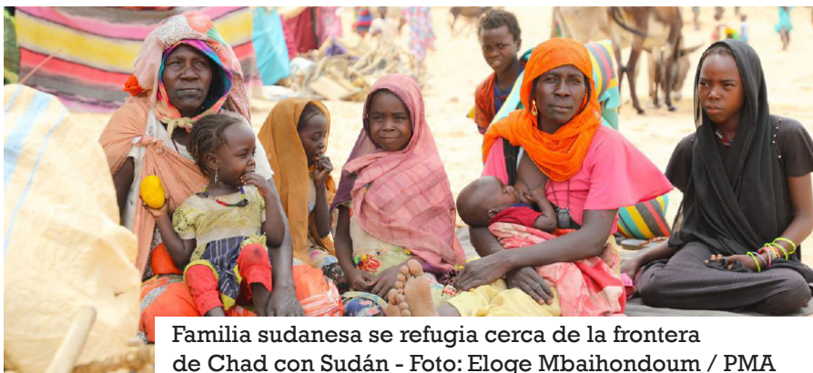
Familia sudanesa se refugia cerca de la frontera de Chad con Sudán - Foto: Eloge Mbaihondoum / PMA

Actualmente, 1 de cada 17 personas que viven en Chad es un refugiado, según dijo hoy la Oficina de Coordinación de Asuntos Humanitarios de Naciones Unidas.