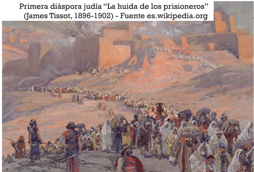
Primera diáspora judía “La huida de los prisioneros” (James Tissot, 1896-1902)

El hecho es que la historia se mueve. Y si se mueve, es porque millones de personas están en marcha. Tal marcha, además, representa la parte aparente y visible de las transformaciones ocultas e invisibles. Las sucesivas caravanas de migrantes y refugiados son como las olas superficiales de las corrientes subterráneas profundas. Al mismo tiempo, velan y revelan los cambios históricos y estructurales en curso, ya sean sociales, económicos, políticos o culturales. Cambios que, según estudiosos y expertos en el tema, han contribuido poderosamente a la concentración del ingreso y la riqueza, por un lado, y a la exclusión so-