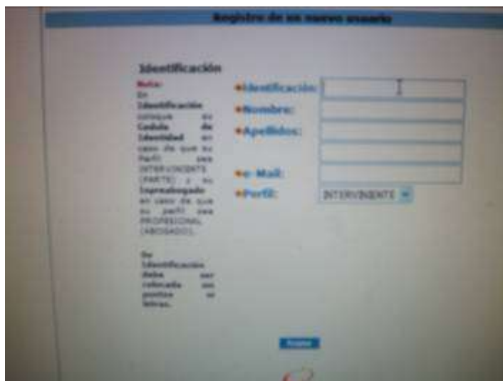
Figura 6: Registro en el Sistema de Consulta Web TSJ