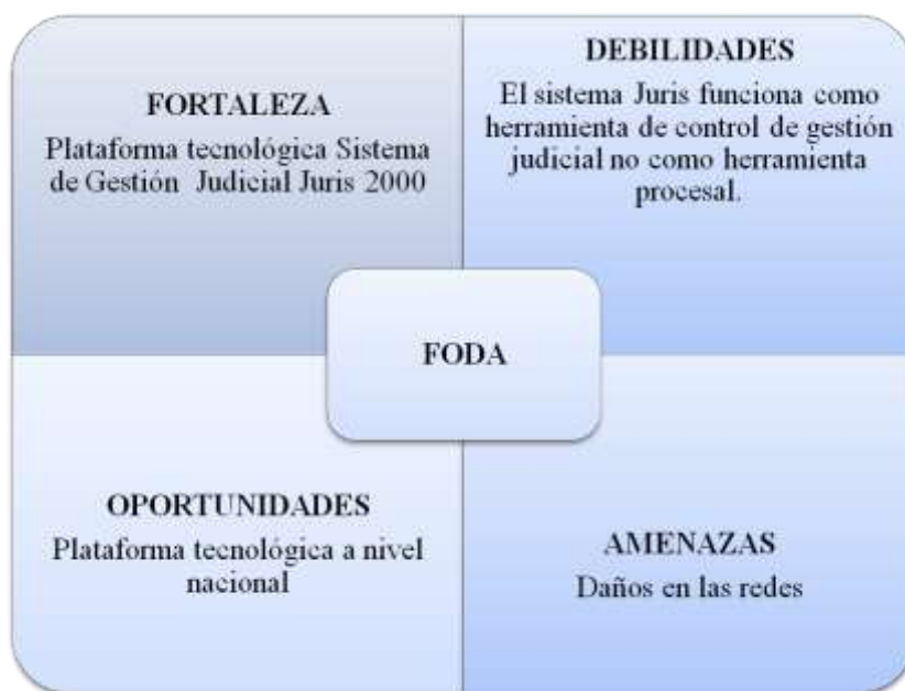
Figura 1: Matriz FODA

organización no se limita a una forma administrativa rígida, por ello integra elementos que tecnifican los procesos como un sistema abierto o cerrado, de tal forma, al entender los fines de los tribunales y la necesidad social de administrar una justicia con procesos gerenciales ágiles, estos también se trasladan a procesos funcionales para alcanzar los principios de una justicia gratuita, accesible, imparcial, idónea, transparente, autónoma, independiente, responsable, equitativa y expedita, sin dilaciones indebidas, sin formalismos o reposiciones inútiles, conforme a lo previsto en el artículo 26 de la constitución de la república Bolivariana de Venezuela (1999).