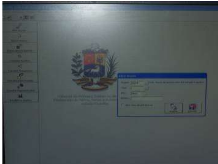
Figura 4: Ingreso al Juris 2000