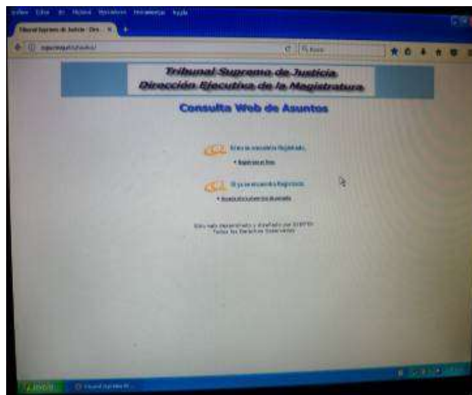
Figura 5: Sistema de Consulta Web TSJ