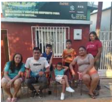
Informante 3: FAMILIA LUNA