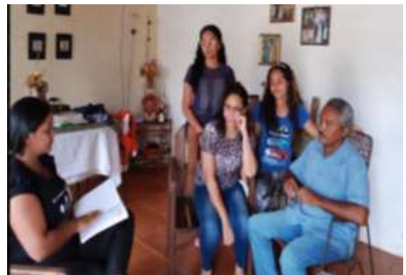
Informante 2: FAMILIA SOL