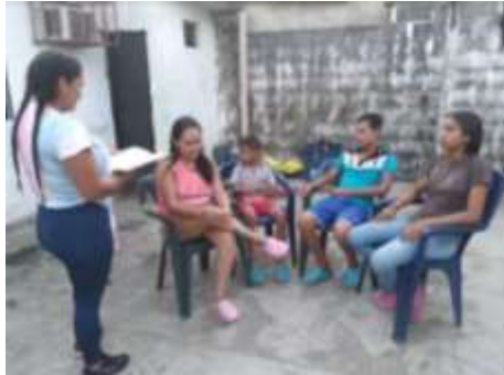
Informante 1: FAMILIA ESTRELLA