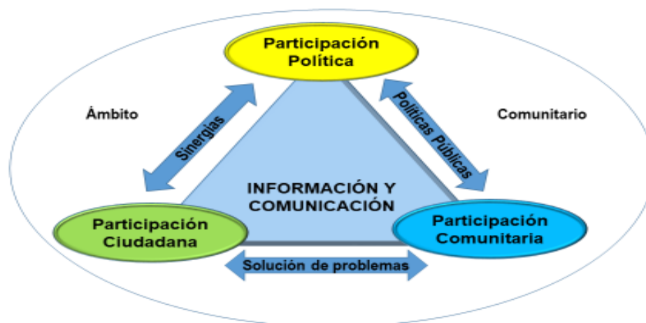
Figura 3. Codificación Selectiva.

Considerando lo planteado, se presenta la Figura 3 relacionada con la emergencia de categorías contentiva de la codificación selectiva.