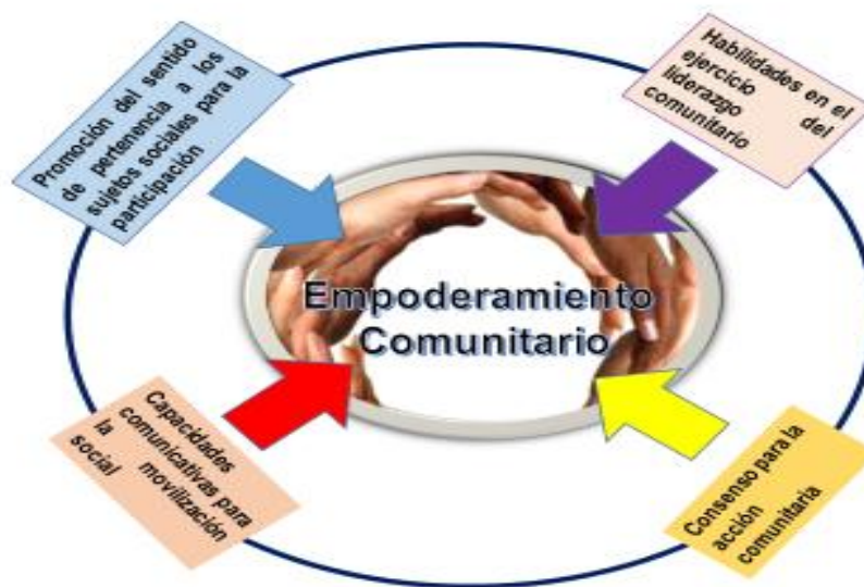
Figura 1. Codificación Selectiva.

proyectos de vida conforme a valores conjuntamente con criterios, generando calidad de vida, para así implicar el colectivo, direccionado hacia el cambio y transformación social para la organización de los sujetos, tomando en cuenta mecanismos, sistemas o estructuras que garanticen posibilidades, así como derechos a los habitantes de la comunidad. Considerando lo planteado, se presenta la Figura 1 relacionada con la emergencia de categorías contentiva de la codificación selectiva.