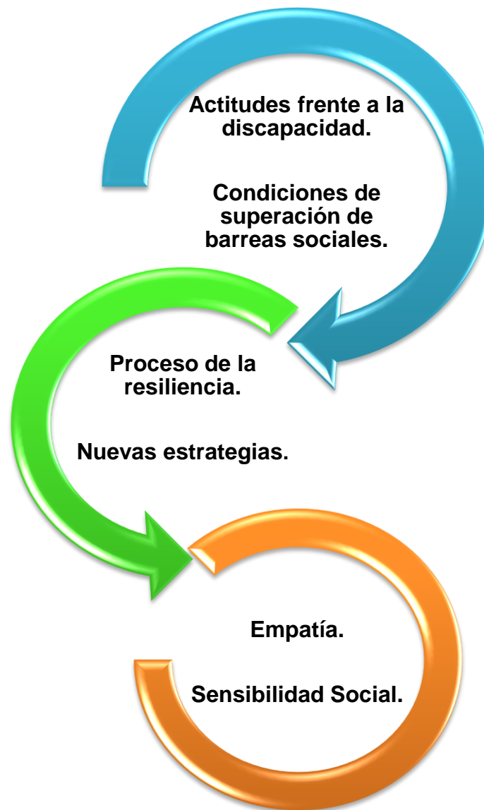
Diagrama: Proceso para el desarrollo del modelaje social.

Esto es un sistema donde las estructuras que entran como insumo son las actitudes frente a la discapacidad y las condiciones de superación de barreras sociales, en personas con discapacidad motriz, dado que el impulso