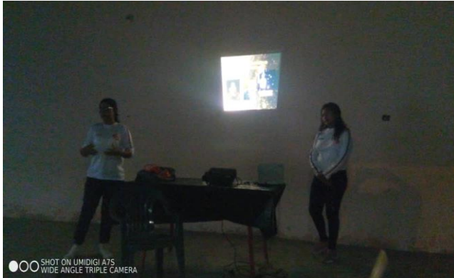
Fórum sobre la empatía, realizado en la Iglesia (Fuente de Vida) Fecha: 09/02/2023 Hora: 6:55 pm Lugar: Corralito I calle 16 avenida 2 y 3.