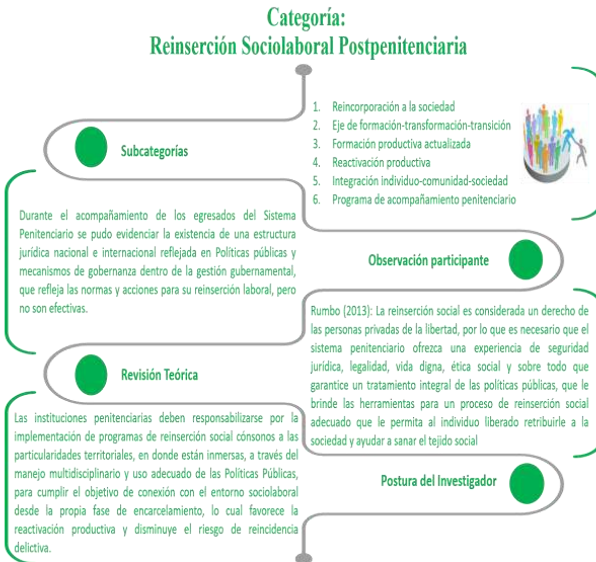
Figura #1. Triangulación de la Categoría Reinserción Sociolaboral Postpenitenciaria

adecuada asistencia a las actividades durante su período en la cárcel, esto podría favorecer su desarrollo, contribuyendo así al despliegue de sus virtudes y fortalezas.