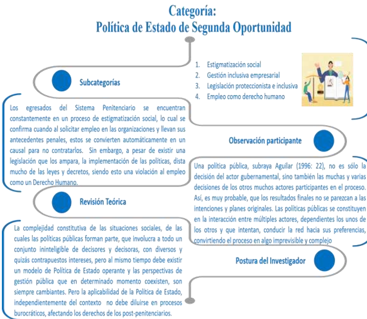
Figura #2. Triangulación de la Categoría Política de Estado de Segunda Oportunidad

vez que regresa a la sociedad, se evidencia en los distintos contextos en las que se desarrolla, ya sea desde el ambiente laboral hasta su entorno familiar, por tanto este rechazo puede conducir nuevamente a estas personas a realizar actividades ilícitas o delictivas, por ser en la mayoría de los casos, las únicas formas de acceder a los vínculos laborales, delinquiendo, debido a las débiles líneas de acción existentes para la reincorporación a la Sociedad.