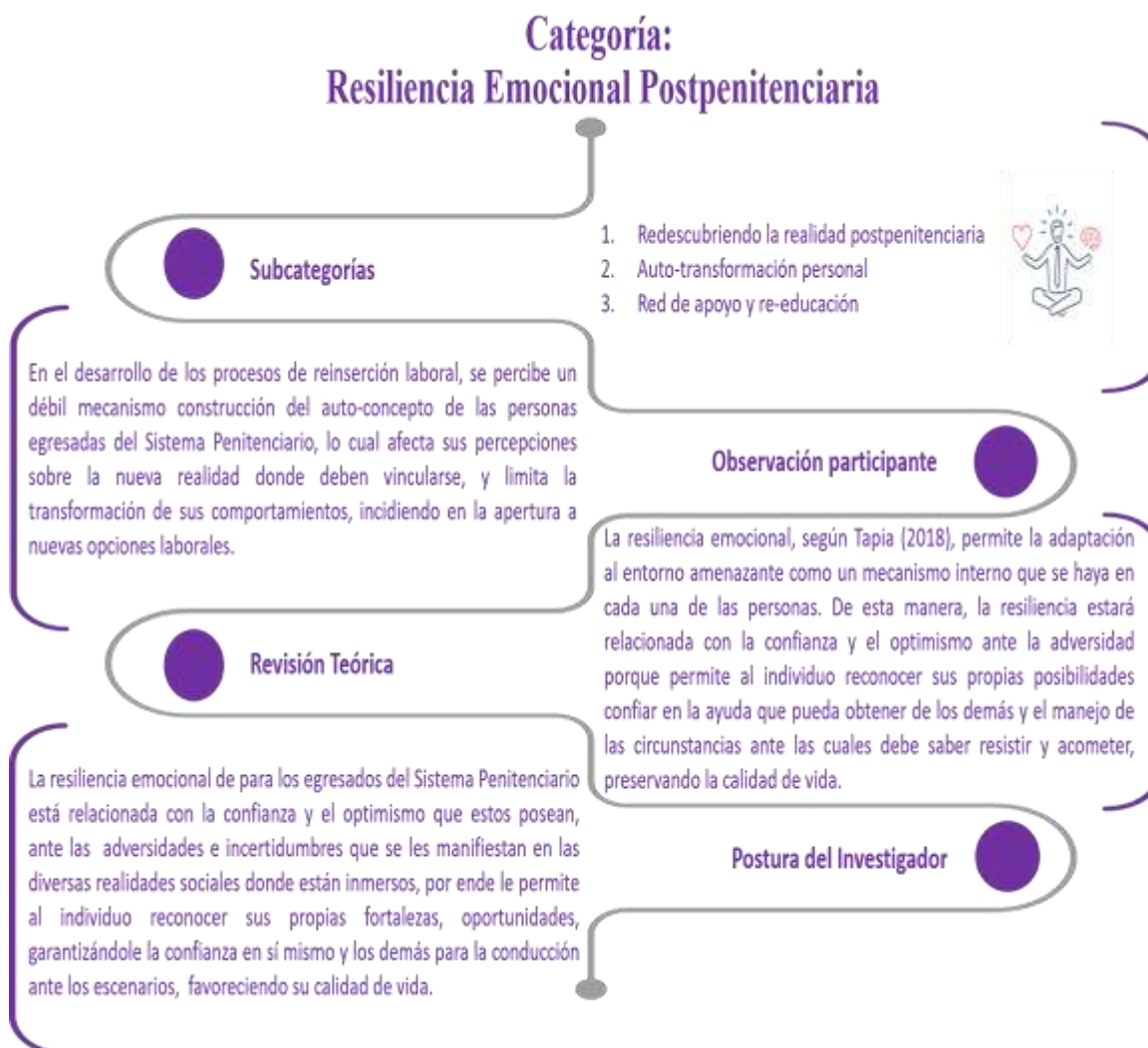
Figura # 3. Triangulación de la Categoría Resiliencia Emocional Postpenitenciaria