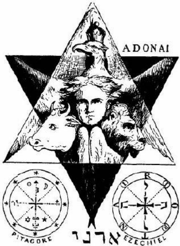
Fig. 7 Los pantáculos de Ezequiel y Pitágoras 1