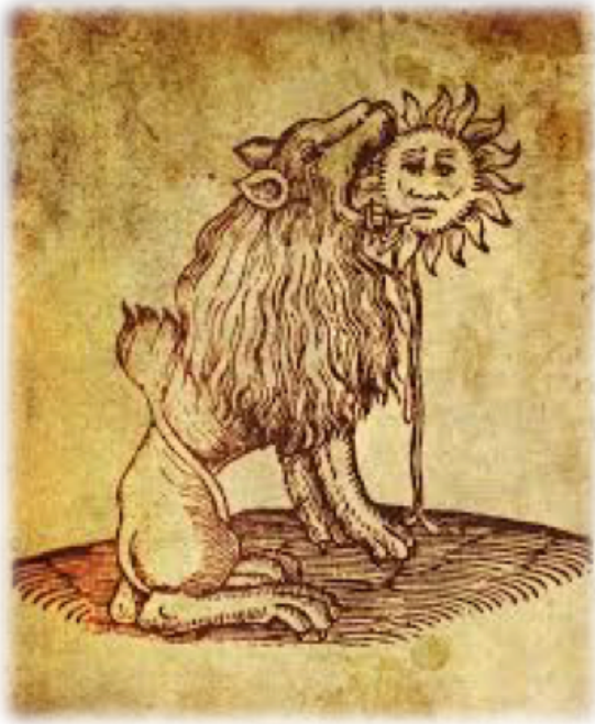
El león verde devorando el sol. "Rosarium Philosopharum". (1550). Frankfurt.