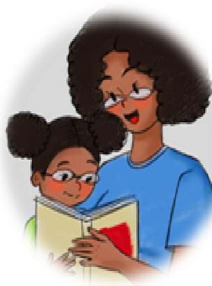
Padres lectores = Hijos lectores