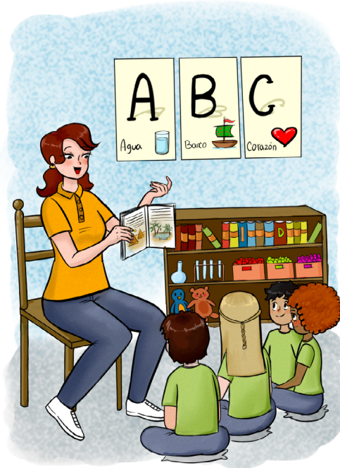
Docentes promotores de lectura = Docentes lectores

Por tanto, el/la docente debe promover actividades de lectura en sus planes de clases, esto garantizará que el niño(a) pueda adquirir el hábito lector, y que los padres o adultos significativos lleven el seguimiento, además de reforzarlo, sólo así se podrá en forma conjunta lograr que el proceso de lectura se de en forma efectiva.