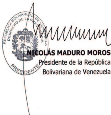
NICOLÁS MADURO MOROS Presidente de la República Bolivariana de Venezuela

Refrendado La Vicepresidenta Ejecutiva de la República Bolivariana de Venezuela y Primera Vicepresidenta del Consejo de Ministros (L.S.)