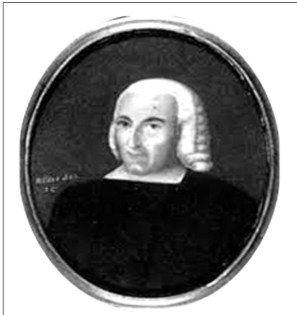
Foto 3. El fiscal Francisco Antonio Moreno y Escandón