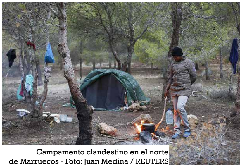
Campamento clandestino en el norte de Marruecos

Cabe destacar que, en su mayoría, los refugiados sirios constituyen la comunidad más grande de asilados en el país norteafricano. Las cifras apuntan a que residen ya en Marruecos unas 5.150 personas de esta etnia. La presencia de sirios lleva bastante tiempo siendo la mayoritaria en el Reino. El Alto Comisionado para la Planificación (HCP) realizó en 2021 una encuesta sobre la migración forzada en el país donde reveló que uno de cada dos refugiados era de origen sirio. Esta población representa el 54,4% del número total de refugiados.