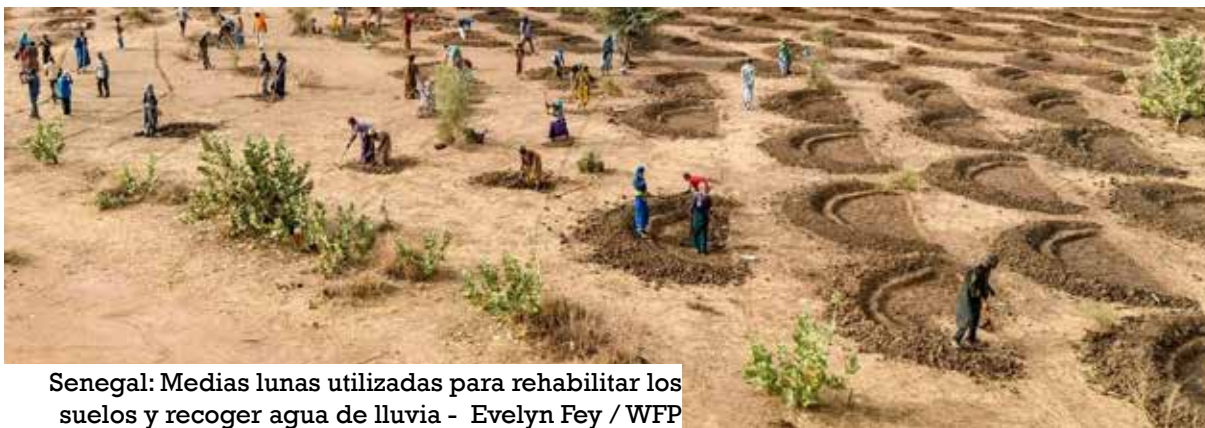
Senegal: Medias lunas utilizadas para rehabilitar los suelos y recoger agua de lluvia

L a guerra en Ucrania está agravando una “triple crisis alimentaria, energética y financiera” en toda África, según el Secretario General de la ONU, António Guterres.