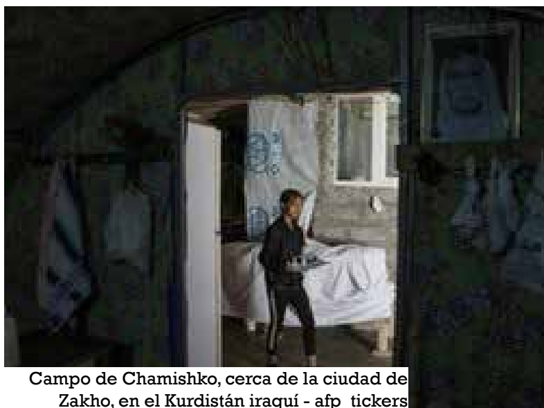
Campo de Chamishko, cerca de la ciudad de Zakho, en el Kurdistán iraquí

Cerca de las oficinas de la administración, decenas de hombres y mujeres hacen fila frente a un camión que