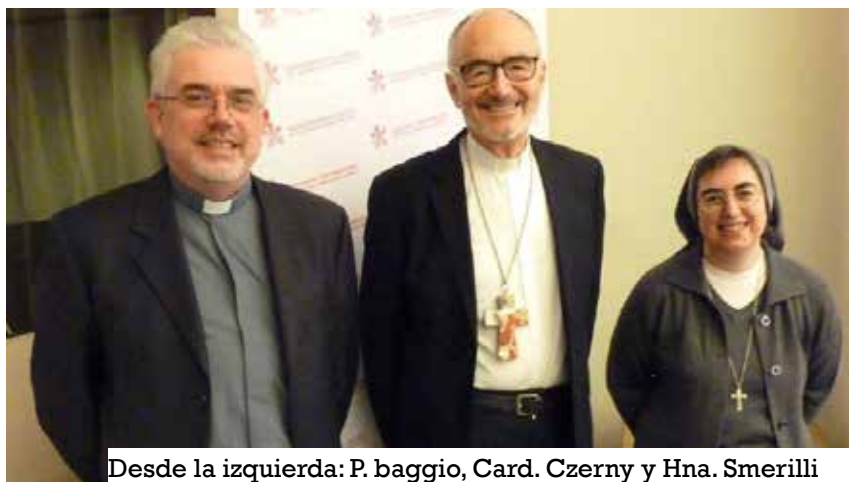
Desde la izquierda: P. baggio, Card. Czerny y Hna. Smerilli

En una declaración conjunta, Czerny, Smerilli y Baggio agradecen al Santo Padre “la confianza que ha depositado en nosotros y en nuestro trabajo. Agradecemos a todos los que han colaborado con nosotros durante este período intermedio en el cumplimiento de la misión del Dicasterio. Nuestros pensamientos de agradecimiento van dirigidos a Card. Peter K.A. Turkson y todos los que han servido como Superiores en el Dicasterio hasta el final de 2021”... *