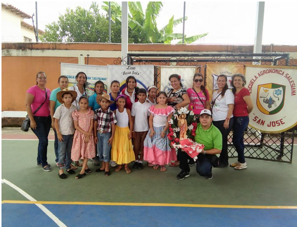
Figura 1. Grupo Estable de la Escuela Bolivariana “Las Palmas” participando en un Encuentro Cultural Intercircuital en el Colegio Andrés Eloy Blanco

Esto se corresponde con lo planteado por Amarista y Camacho (2009) sobre la noción de estrategia pues hace alusión al “conjunto de líneas de acción que precisan el camino a recorrer” dado que otorga un grado de especificidad a las políticas públicas pues “sirven de guía para definir prioridades, establecer rumbos y asignar recursos racionalmente”, a tales fines se propuso diseñar una estrategia orientada a promover la formación de habilidades para la interpretación del Patrimonio Cultural (PC) a través de la conformación de los Grupos Estables (Figura 1), específicamente las Brigadas Patrimoniales (p. 182).