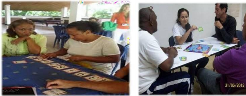
Figuras 11 y 12. Juegos populares de mesa. Imágenes de Actividades recreativas realizadas con los docentes en instituciones educativas.