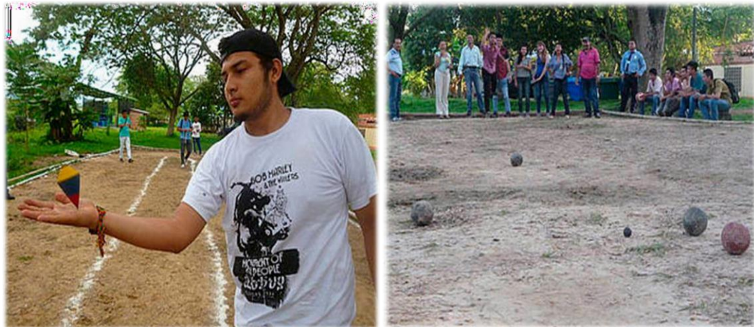
Figuras 9 y 10. Juegos Tradicionales: Imágenes de Actividades recreativas realizadas con los docentes en instituciones educativas.