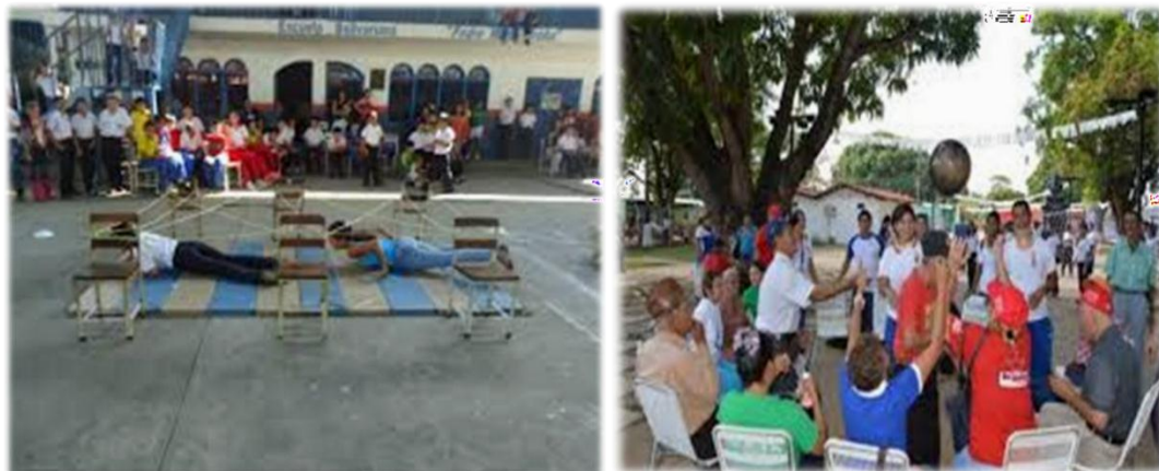
Figuras 3y 4. Deportes Prerecreativos. Actividades realizadas los docentes en instituciones educativas.

Disciplinas deportivas, autóctonas o foráneas, que no forman parte del programa olímpico, pero que responden a gustos y preferencias de las personas para la ocupación del tiempo libre, generalmente organizándose en clubes, asociaciones o federaciones