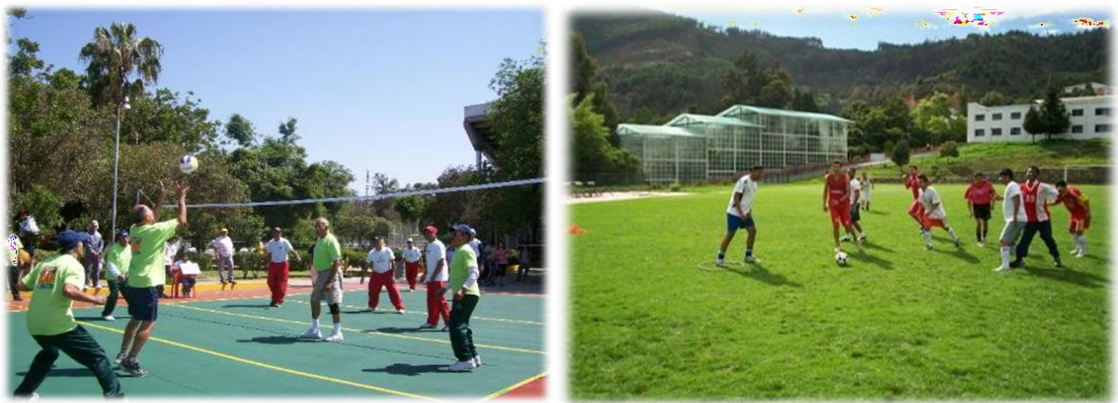
Figuras 5 y 6. Espectáculos Deportivos. Imágenes de Actividades recreativas realizadas con los docentes en instituciones educativas.

En tal sentido, toda actividad deportiva es un medio de comunicación que sirve de beneficio en lo individual y lo colectivo, proporcionando un aprendizaje que ayudan a distraerse y poder salir de la rutina que diaria.