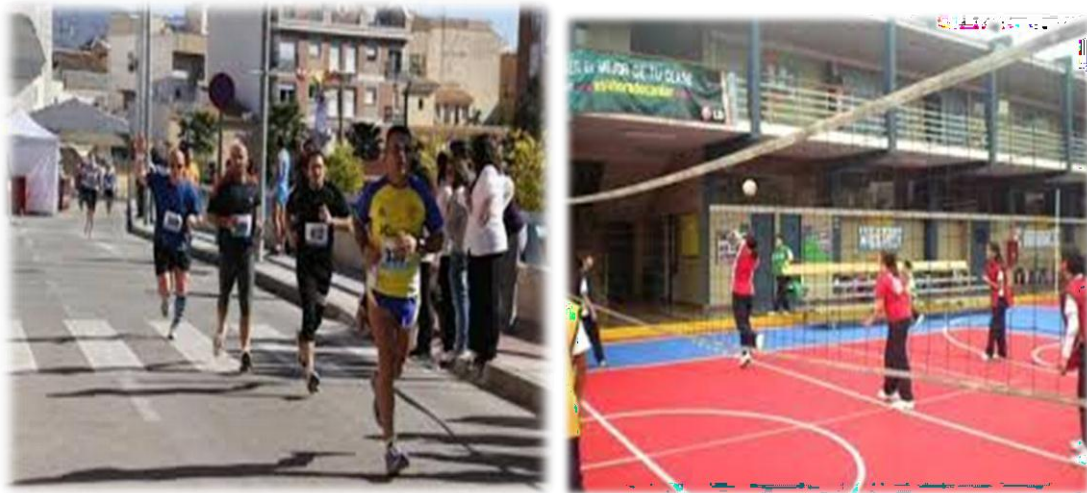
Figuras 7 y 8. Encuentros de deportes populares. Imágenes de Actividades recreativas realizadas con los docentes en instituciones educativas.

Son actividades que combinan, en mayor o menor medida, distintas facetas de los juegos y del deporte, como el entretenimiento, el desarrollo físico, el estímulo mental y la competencia que son elementos esenciales para las condiciones físicas y mentales.