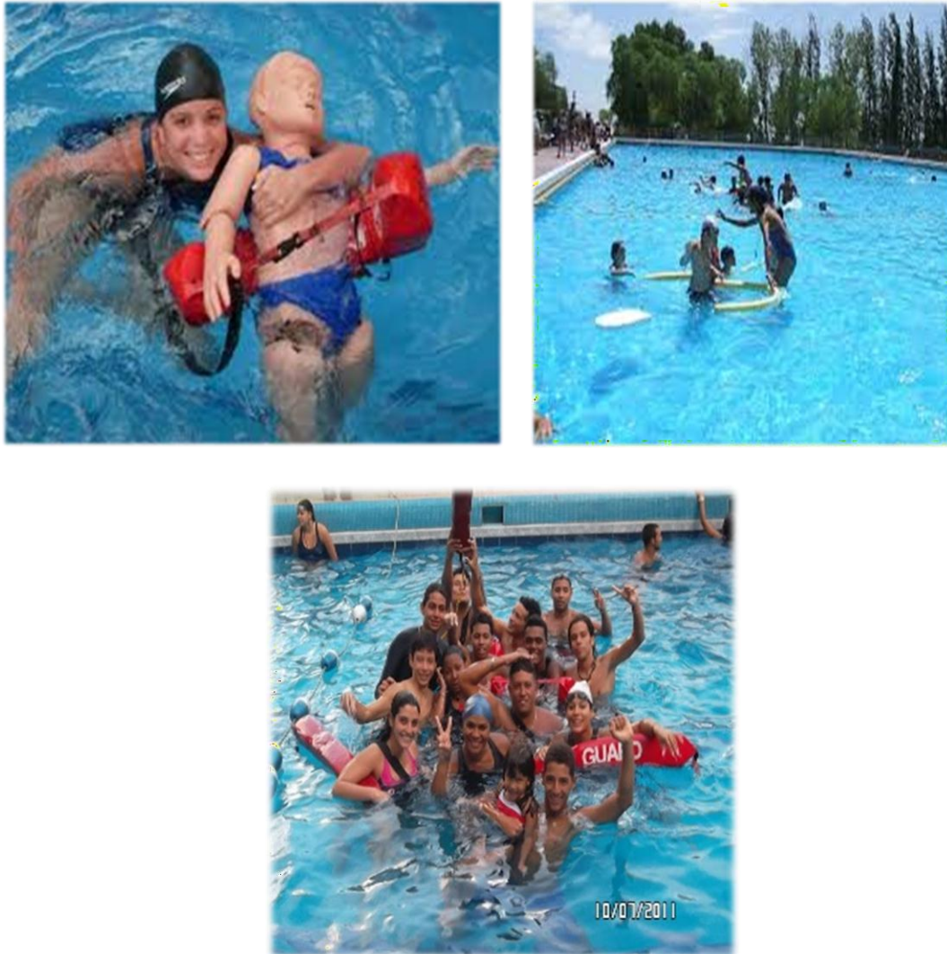
Figura 16,17 y 18 Actividades acuáticas (playas, ríos, piscinas) Imágenes de Actividades recreativas realizadas con los docentes en instituciones educativas.