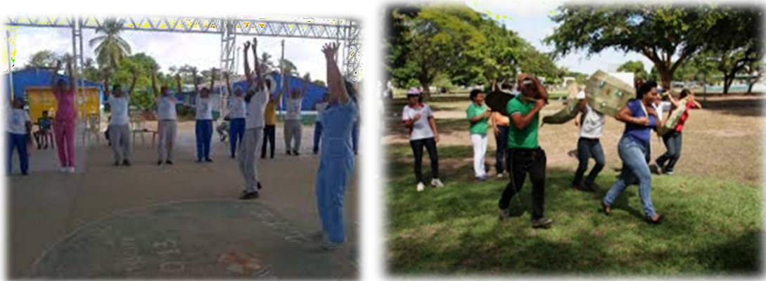
Figura 1 y 2. Actividades Lúdico-Recreativas. Imágenes de Actividades recreativas práctica en su contexto.

Es de reconocer que la importancia que existe de las actividades Ludico-Recreativas se basa en lograr que el docente comprenda su ejecución para poder interpretar y analizar los hallazgos que producen una vez que se experimenta su