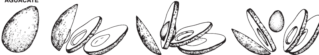
FIGURE 3.1 PUNTOS DE VISTA DE LA NATURALEZA HUMANA DEL AGUACATE Y LA ALCACHOFA Cuando quitamos las partes externas de un aguacate encontramos la semilla que contiene su esencia, pero cuando pelamos la alcachofa de sus capas exteriores, no encontramos un corazón central.